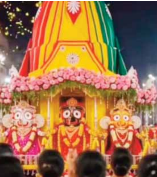
हरिभूमि न्यूज अनूपपुर।

इस्कॉन केंद्र के अनूपपुर में प्रारंभ होने के बाद धर्म के प्रति लोगों का रुझान काफी तेजी से बढ़ा है। लोगों में नई चेतना का संचार हुआ है। युवा वर्ग धर्म के प्रति काफी आगे बढ़ गया। अनूपपुर की धरती में धर्म के तमाम आयोजन होते चले आ रहे हैं जिसमें युवा वर्ग की महत्वपूर्ण भूमिका है। अनूपपुर में इस्कॉन केंद्र की स्थापना के बाद एक नई चेतना का उदय हुआ है। इस्कॉन केंद्र से लोग जुड़कर धर्म की तरह-तरह की जानकारीयों पाठ्यपुस्तकों के माध्यम से पा रहे हैं। केंद्र में सत्संग भी हो रहा है जिसमें भी सभी लोग शामिल हो रहे हैं और बढ़ चढ़कर हिस्सा ले रहे हैं। इस्कॉन केंद्र ने लोगों के मिल रहे सहयोग से अनूपपुर के इतिहास में पहली बार भगवान जगन्नाथ की रथ यात्रा को निकालने का बेड़ा उठाया है जिसकी तैयारियां भी लगभग पूर्ण हो चुकी हैं और नगर के लोगों का अच्छा सहयोग भी