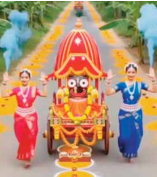
हरिभूमि न्यूज अनूपपुर।

इस्कॉन केंद्र के अनूपपुर में प्रारंभ होने के बाद धर्म के प्रति लोगों का रुझान काफी तेजी से बढ़ा है। लोगों में नई चेतना का संचार हुआ है। युवा वर्ग धर्म के प्रति काफी आगे बढ़ गया। अनूपपुर की धरती में धर्म के तमाम आयोजन होते चले आ रहे हैं जिसमें युवा वर्ग की महत्वपूर्ण भूमिका है। अनूपपुर में इस्कॉन केंद्र की स्थापना के बाद एक नई चेतना का उदय हुआ है। इस्कॉन केंद्र से लोग जुड़कर धर्म की तरह-तरह की जानकारीयों पाठ्यपुस्तकों के माध्यम से पा रहे हैं। केंद्र में सत्संग भी हो रहा है जिसमें भी सभी लोग शामिल हो रहे हैं और बढ़ चढ़कर हिस्सा ले रहे हैं। इस्कॉन केंद्र ने लोगों के मिल रहे सहयोग से अनूपपुर के इतिहास में पहली बार भगवान जगन्नाथ की रथ यात्रा को निकालने का बेड़ा उठाया है जिसकी तैयारियां भी लगभग पूर्ण हो चुकी हैं और नगर के लोगों का अच्छा सहयोग भी